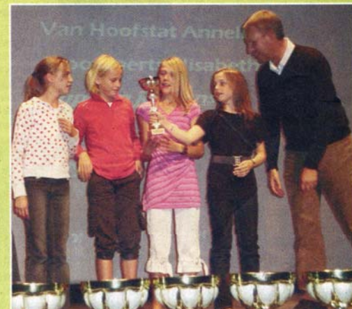
De pupillen meisjes die tweede werden op de provinciale kampioenschappen en tweede op de Belgische kampioenschappen in dezelfde discipline.