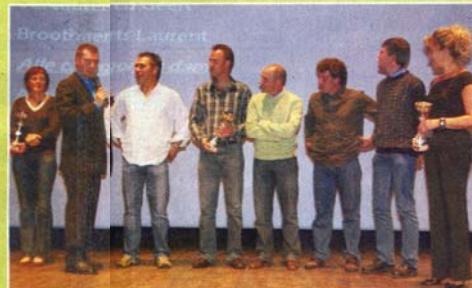
De gehuldigde masters vertellen over hun prestaties