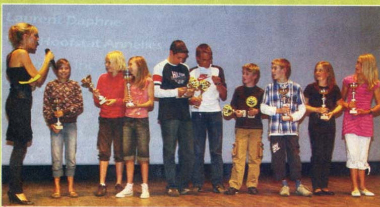
De miniemen jongensploeg 4 x 80m en de pupillen meisjesploeg 4 x 60m