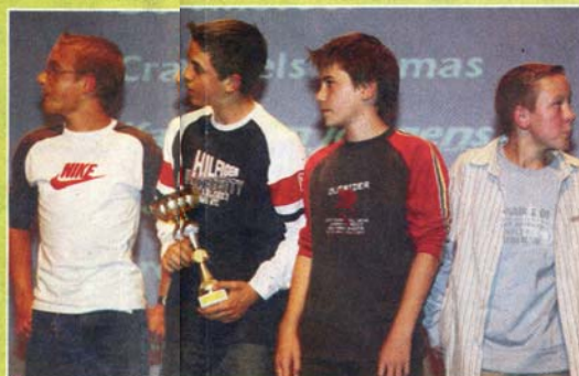
De miniemen jongensploeg 4 x 80m